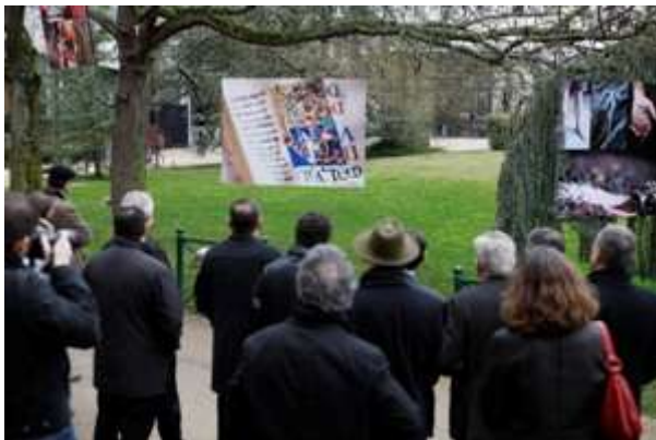
Inauguration de l'exposition dans les Jardins du Conseil Général le 20 janvier 2012