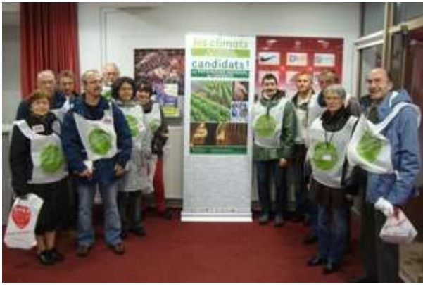
De nombreux bénévoles étaient présents !