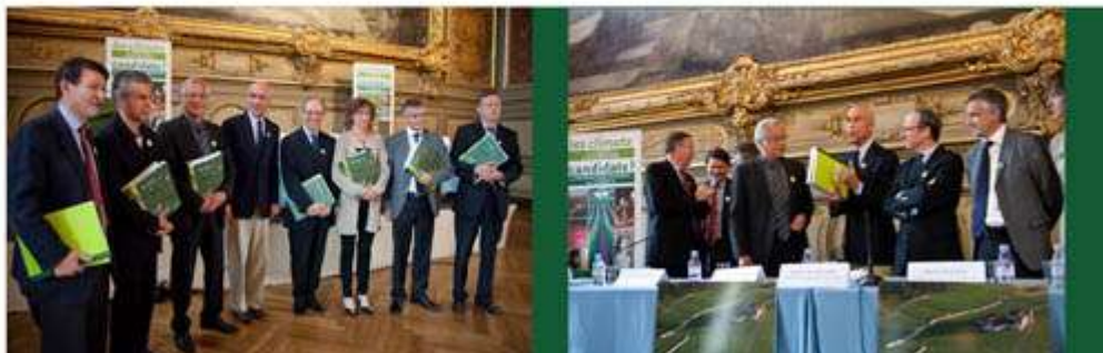
Remise du dossier de candidature aux partenaires de l'Association lors de la conférence de presse du 25 juin 2012