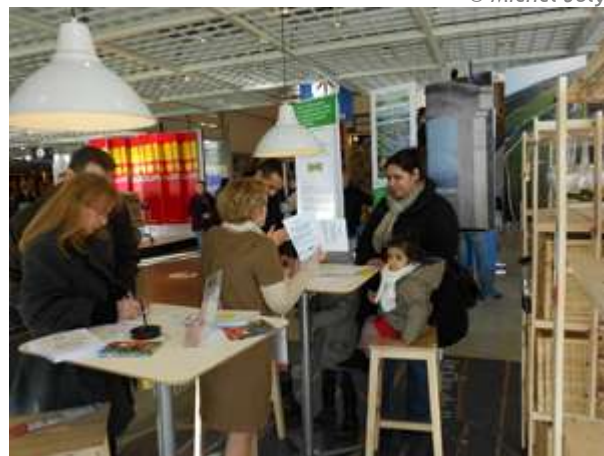
Stand d'information sur la candidature à l'accueil du magasin

Mis en circulation en partenariat avec la Confrérie des Chevaliers du Tastevin et le Conseil Régional de Bourgogne, à l'occasion de la Saint-Vincent, ce train TER aux couleurs de la candidature dessert la ligne Dijon / Chalon-sur-Saône jusqu'à la fin de l'année 2013. Montez à bord !