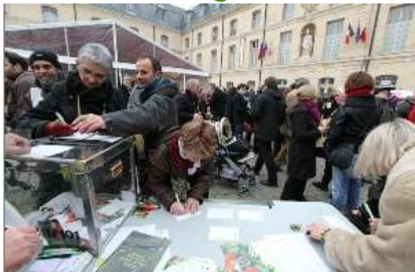
Stand d'information des climats à Dijon