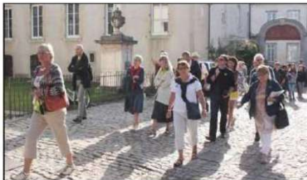
Les participants sont partis découvrir le lien entre le centre historique de Beaune et la gastronomie.