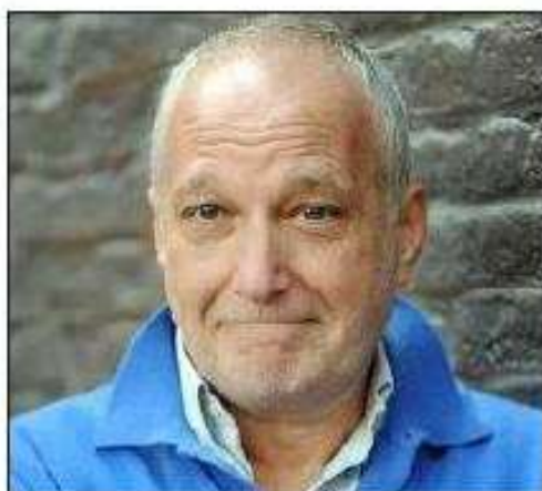
A l'image de l'acteur François Berliand, de nombreuses personnalités soutiennent cette candidature.

De son côté, l'association pour l'inscription des climats du vignoble de Bourgogne au patrimoine mondial de l'Unesco poursuit ses efforts. Cette année 2011 est mise à profit pour finaliser le dossier de candidature qui sera remis aux autorités françaises avant Noël. Si la France le retient, elle le déposera auprès de l'Unesco en janvier 2012. Quant à l'échéance finale, l'éventuelle inscription au patrimoine