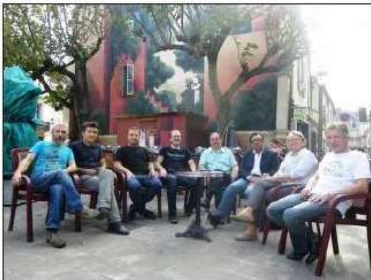
Les commerçants du quartier Jean-Jacques-Rousseau-Antiquaires se mobilisent.