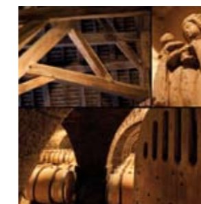
En Clos de Tart

- un des quatre pressoirs des moines de Cîteaux dans l'ancienne cuverie du Château du Clos de Vougeot - Vue arrière du Château du Clos de Vougeot