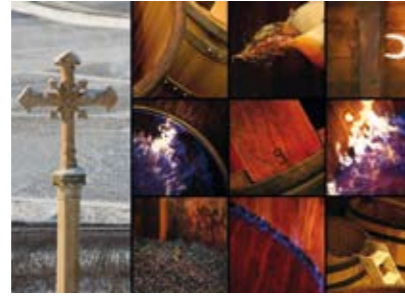
Des climats de glace et de feu