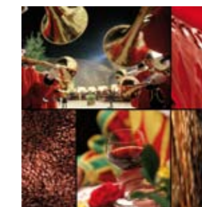
Trompes et Tastevin

- cave du Clos de Tart, Morey-Saint-Denis - vierge en bois du XIV e qui rappelle que le Domaine appartenait à la Communauté des Bernardines de Tart