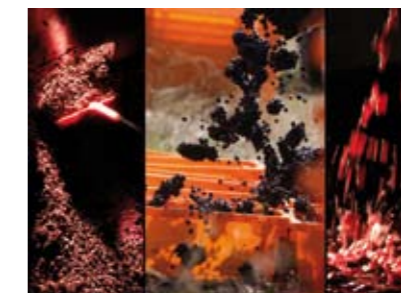
Vendange et vinification

- toits du Château du Clos de Vougeot, vue sur les Echezeaux, la Combe d'Orveau, les Musigny