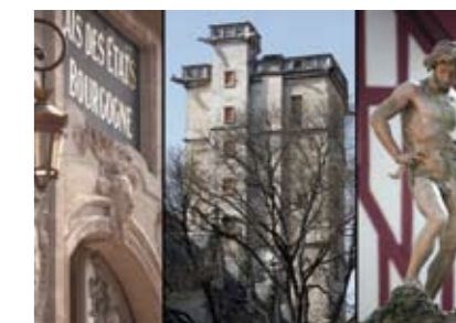
Bar et Bareuzai

- décuvaage, Domaine Roumier, Chambolle-Musigny - vendange orange, Clos des Lambrays, Morey-Saint-Denis - pressurage du vin rouge, Domaine du Clos de l'Arlot, Premeaux-Prissey