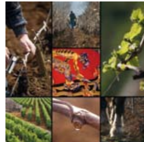
Un homme et sa vigne