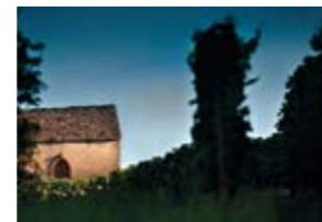
Sous les étoiles, exactement