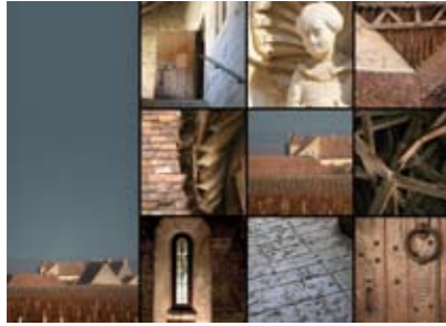
Le Clos de Vougeot en habit d'hiver