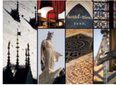
L'Hôtel-Dieu de Beaune