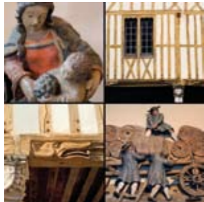
Musée du Vin