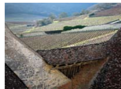
Du ciel de Vougeot

- toits du Château du Clos de Vougeot, vue sur les Echezeaux, la Combe d'Orveau, les Musigny