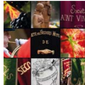
La Saint-Vincent Tournante