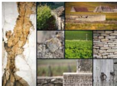
Des climats au cœur de pierre