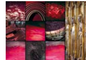
Larmes de sang