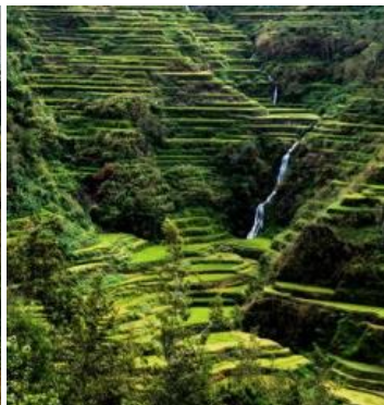
Rizières en terrasses d'Ifugao (Philippines)