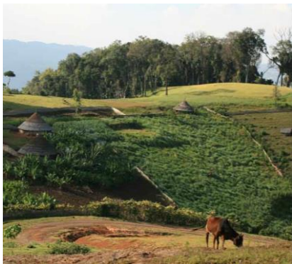
Habitat traditionnel et forêt de Caféiers à Kafa (Ethiopie)