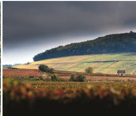
Vignoble des Climats de Bourgogne (France)