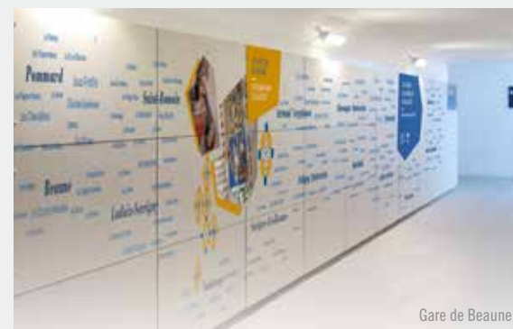
Gare de Beaune

La valorisation du territoire passe par la promotion touristique du site inscrit et par le tissage de différents réseaux de promotion.