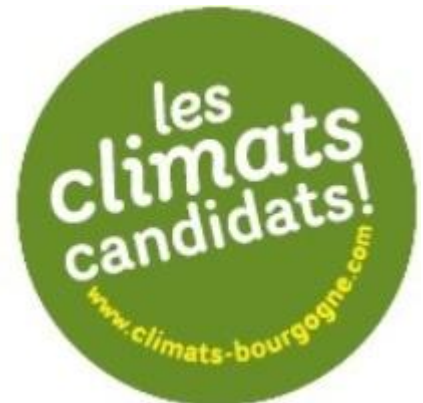
Badge de l'Association