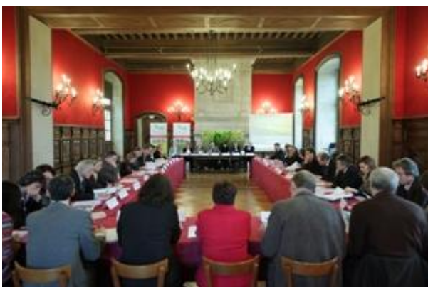
Comité stratégique et politique

/// Site de l'Association Bassin Minier Uni