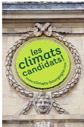
L'énorme badge de soutien, ici sur l'Horloge du Palais des Ducs de Dijon, habillera la façade extérieure de l'ESC

L'association met tout en œuvre pour déposer le dossier de candidature auprès de l'Etat français pour la fin de l'année 2011. Affaire à suivre.