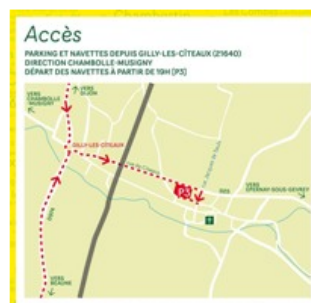
Plan d'accès © Les Pistoleros

Krystel LEPRESLE, Association pour l'inscription des climats du vignoble de Bourgogne au Patrimoine mondial de l'Unesco 12 Bld Bretonnière - 21200 BEAUNE Tel: 03.80.20.10.40 - Mob: 06.08.11.34.95 contact@climats-bourgogne.com