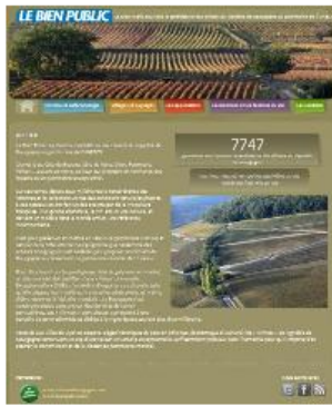
Site internet de soutien à la candidature du Bien Public