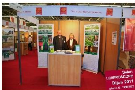
Monsieur et Madame Valognes, fidèles bénévoles de l'Association présents au Salon