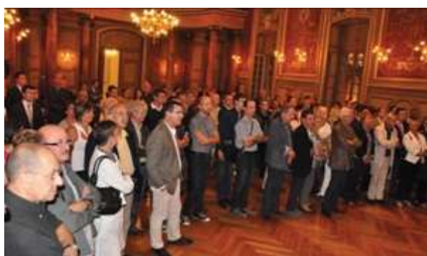
Soirée de lancement le 3 octobre 2011 à Dijon.

/// Retrouvez tous les jours un article dédié à la candidature des climats du vignoble de Bourgogne dans le Bien Public