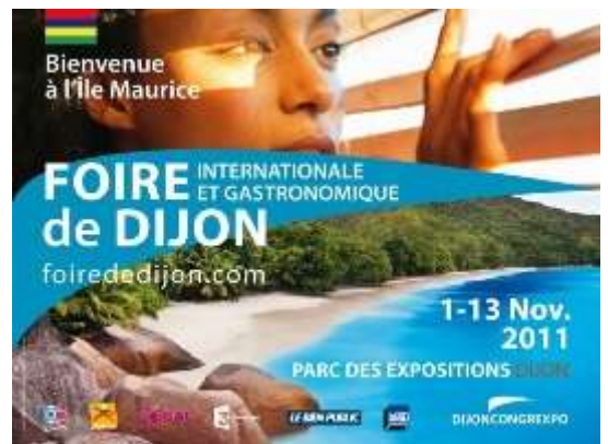
L'île Maurice à l'honneur cette année

/// Rendez-vous les 24 et 25 novembre 2011 au Parc des Expositions de Dijon