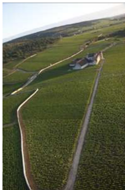
Le tirage au sort de ce mois de décembre aura lieu au Château du Clos de Vougeot, qui offre deux pass-murailles

/// Soutenez les climats du vignoble de Bourgogne avec le Bien Public