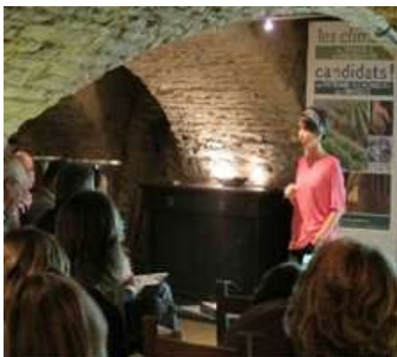
Plus d'une centaine de personnes ont répondu présent aux deux réunions.