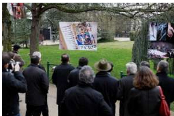
Inauguration de l'exposition dans les Jardins du Conseil Général le 20 janvier 2012