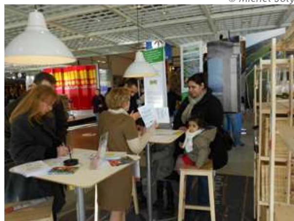
Stand d'information sur la candidature à l'accueil du magasin

Mis en circulation en partenariat avec la Confrérie des Chevaliers du Tastevin et le Conseil Régional de Bourgogne, à l'occasion de la Saint-Vincent, ce train TER aux couleurs de la candidature dessert la ligne Dijon / Chalon-sur-Saône jusqu'à la fin de l'année 2013. Montez à bord !