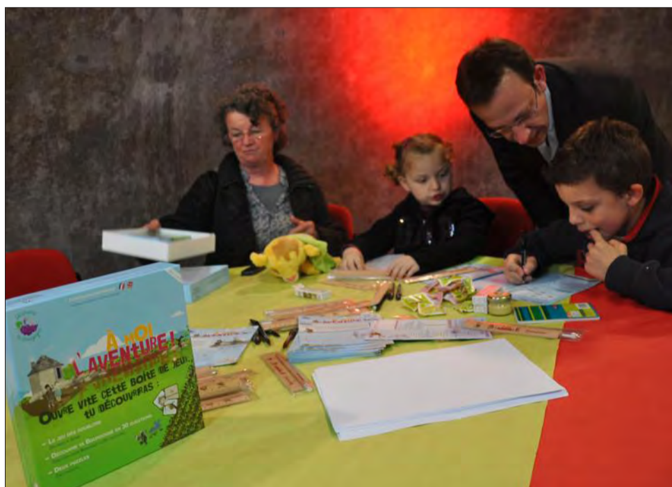
Plusieurs enfants ont été invités à Beaune mercredi pour tester le jeu « A moi l'aventure ».

Rendre la culture du vin accessible aux plus jeunes : un défi de taille que le BIVB est prêt à relever en lançant pour l'occasion une boîte de jeux éducatifs sur le vignoble bourguignon.